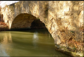
Puente sobre el Canal

Cruzamos Vía Ibérica por el paso regulado por semáforo y retomamos el camino del canal por su margen izquierda. Al principio el canal fluye recto para realizar luego un pronunciado giro en el que el comienzo a discurrir bajo los pies de los pinares de Venecia.