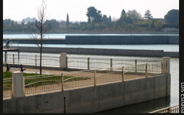
Depósitos de Casablanca

El itinerario comienza en el barrio de Valdefierro. El autobús nos deja al lado de la plaza y desde allí tomamos la calle Osa Mayor hasta llegar a la orilla del Canal Imperial de Aragón .